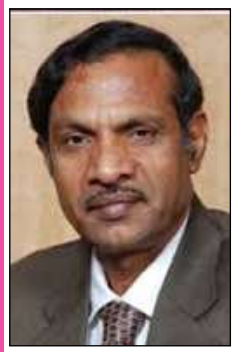
2. ఆచార్య బీలా సత్యనారాయణ ఇన్చార్జ్ వి.సి. ఆంధ్ర విశ్వవిద్యాలయం