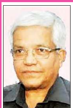
6. శ్రీ ఎం జి గోపాల్ ఐపిఎస్ ఇన్చార్జ్